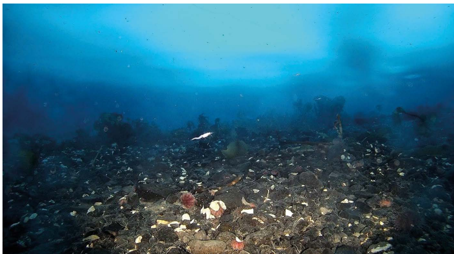
Рис. 2. Участок дна в бухте Северная Fig. 2. A section of the bottom in Severnaya Bay