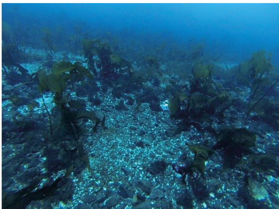
Рис. 3. Участок дна в бухте Зверобоев Fig. 3. A section of the bottom in the Bay of Deerslayers

На участках соприкосновения ледников с подводным береговым склоном отмечено механическое перемешивание донных осадков и полное отсутствие видимого зообентоса. Однако на участках, где ледниковые массы или дрейфующие льды касались дна в прошлом, на валунно-галечном грунте отмечены взрослые актинии и масса офиур, что свидетельствует о том, что эти сообщества в течение относительно длительного времени не испытывали истирающего воздействия ледовых масс. На скальных грунтах в диапазоне глубин от 5 до 20 м отмечен богатый